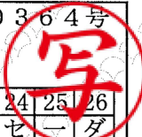
別表 産業廃棄物の種類：金属等を含む廃棄物